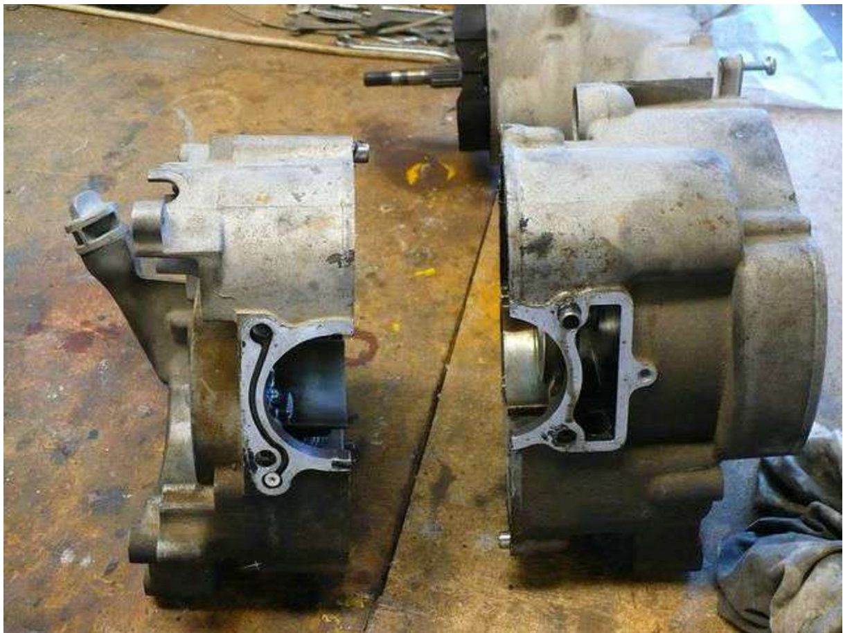
Együtt a másik oldallal.