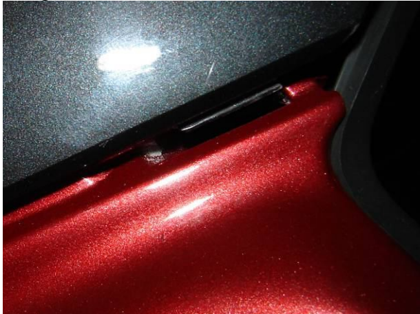
A takaróidom illesztése. Ez is patent, ill. bepattanós.

Ezután már csak a dísz elemet kellett feltenni és kész. Mehetett a kuckójába, mert nagyon hideg volt odakint.