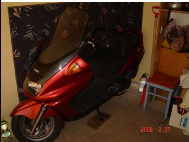
Kicsi mockó kuckója.