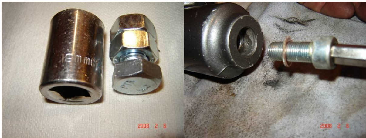
Balról a célszerszám, jobbról a teleszkóp aljából kijövő imbuszcavar.